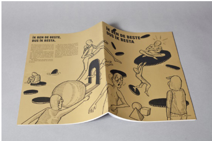
Ik Ben De Beste, Dus Ik besta