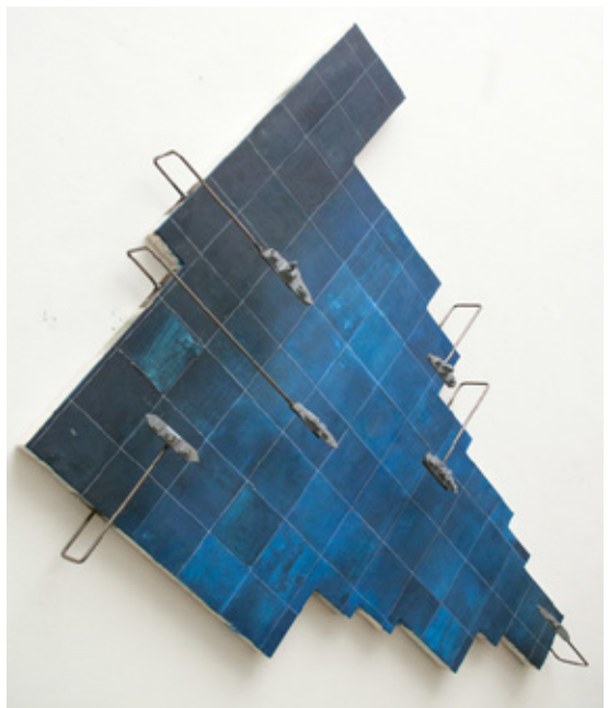
Thomas van Rijs, - 180 cm x 200 cm, 2014 olieverf op doek