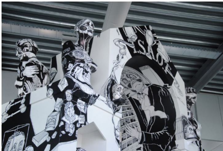
The Social Arch of Triumph hout, verf, fineliner, marker, licht