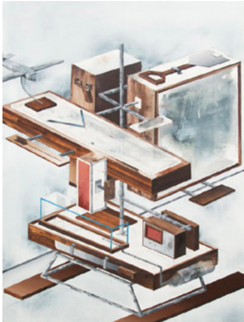
Thomas van Rijs, - 200 cm x 240 cm, 2014 olieverf op doek